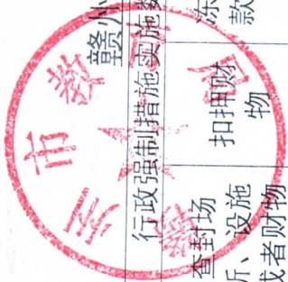
赣州市教育局2021年度行政强制执行实施情况统计表