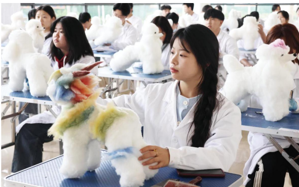
图 16: 宠物养护与经营专业学生正在上宠物美容实训课

台《关于进一步优化全市职业教育专业设置的实施意见》，明确专业建设评估与退出机制、激励与奖惩机制、预警与调整机制，明确强化重点专业布局、增设新兴紧缺专业、升级改造传统专业、裁撤滞后过剩专业、推动专业集群式发展等6项重点任务。开展服务七大产业链职业教育教学成果孵化培育三年行动，扶持学校做大做强特色专业，为产业发展提供更有力的人才支撑和技术支持。2024年全市职业院校开设服务七大产业链相关专业布点475个，占比68%，职业教育服务大局更加强劲有力。比如大余县职业中等专业学校瞄准企业需求，灵活设置专业和课程，2023年新增新能源汽车制造与检测、计算机应用两个热门领域专业；2024年暂停招收幼儿保育专业，增加数控技术应用、工业机器人等相关专业，新增专业首批毕业生已被多家企业预订一空。