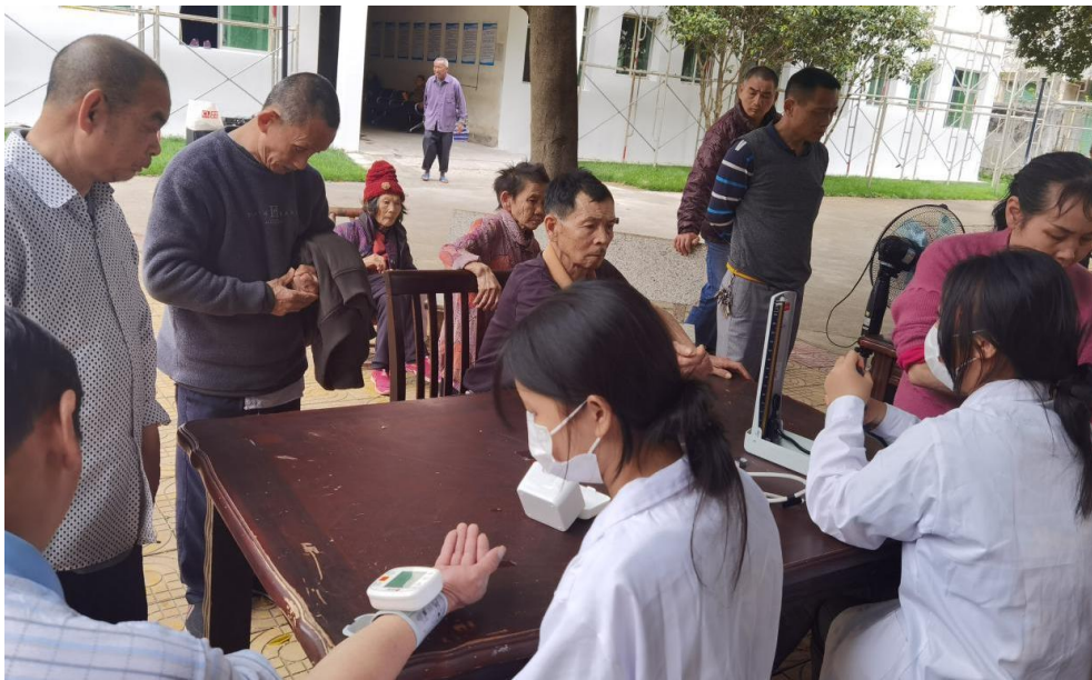
图 14: 信丰中专康复技术专业学生在养老院为老人们体检

信丰中等专业学校积极参与地方社区建设, 定期组织师生走进社区开展义务维修、安全讲座、文化宣传等志愿服务活动。2024 年, 学校各专业服务社区志愿活动累计 1443 人次, 比 2023 年增加 476 人次, 增长比例 49.22%。学校机电专业的师生每学期举行 1 次“走进社区免费家电维修”实践活动, 为留守老人普及电器安全及保养知识; 学校康复技术专业的师生深入县内各大养老院, 利用专业特长为老人们进行体检和按摩、推拿等服务, 将课堂所学运用于实践。