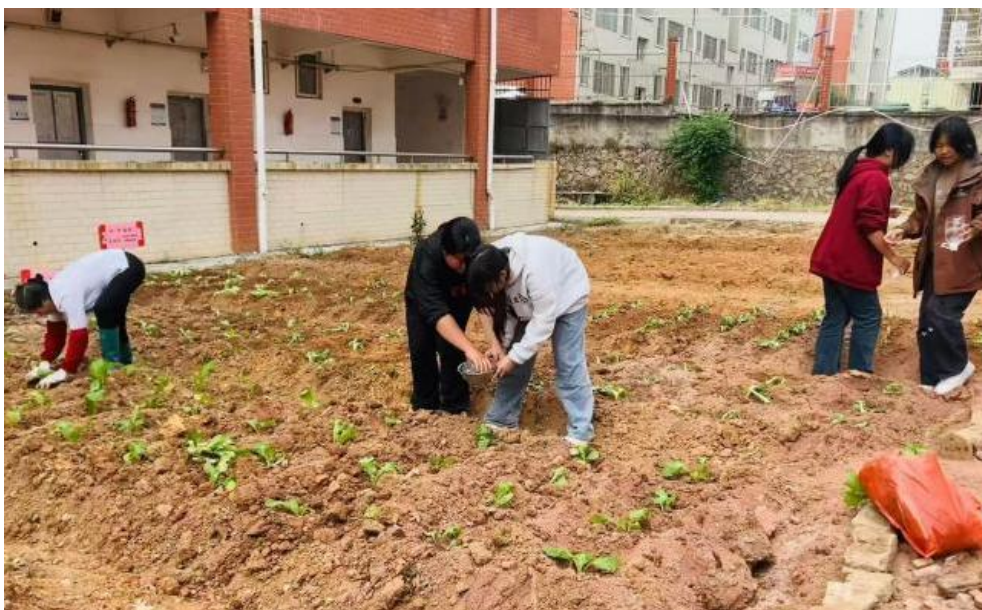
图 5: 会昌中专学生在校进行种植劳动

技能和职业素养。学校制定《会昌中专劳动教育实施方案》，整合校内资源，构建学校、家庭、社会“三位一体”的劳动教育环境。开展“和合”教育理念下的劳动教育实践活动，如校园种植、环境卫生管理，引入企业“7S”管理，制定学校“5S”制度，培养学生责任感、团队合作和职业素养。此外，鼓励学生参与社区服务和志愿者活动，增强社会责任感和公益意识。