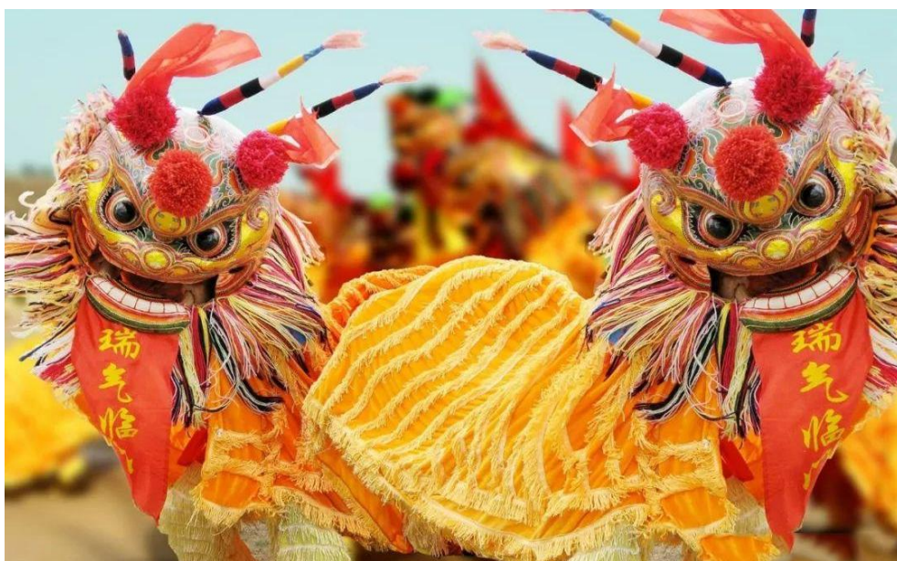
图 15：定南中专学生表演瑞狮节目

定南中等专业学校传承中华传统文化的同时，深耕定南的客家文化，开设了客家舞龙、定南瑞狮、剪纸与吉祥童帽、客家歌谣与采茶戏等文化社团，与定南县文化馆共同培养传统文化传承人，被设立为定南县“客家民俗文化遗产基地”，并成功申报为“定南瑞狮省级传承基地”。