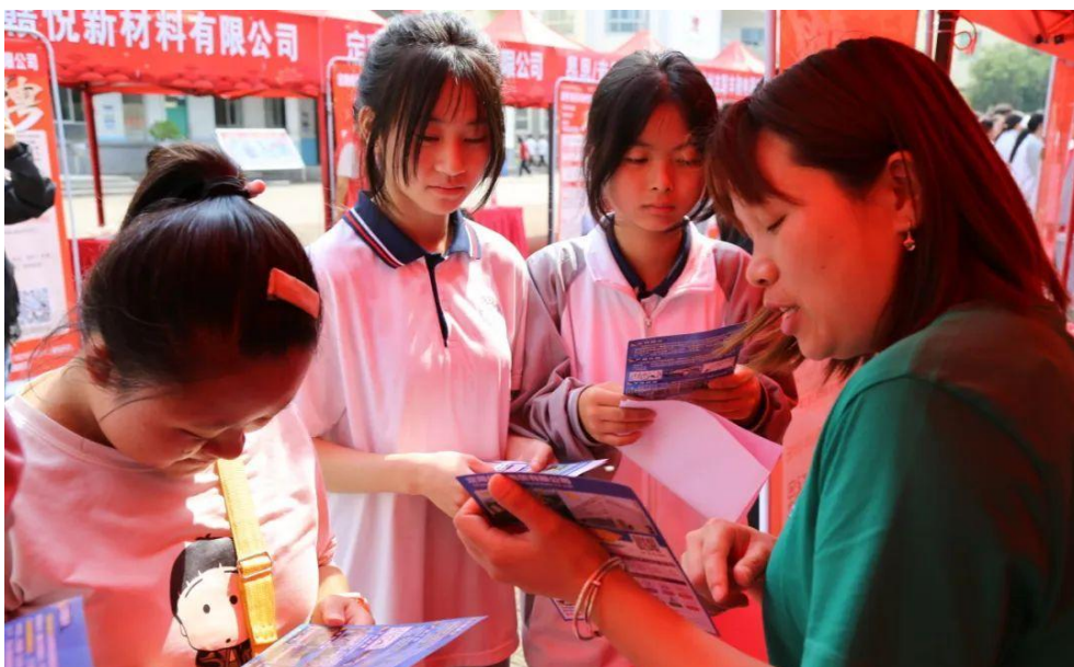
图 8：定南中专联合就业之家开展 2024 年专场招聘会

定南中等专业学校与定南县人力资源和社会保障局、定南县就业创业服务中心联合举办“定南中等专业学校就业之家 2024 年专场招聘会”，全县 20 余家优质企业参会，提供了 300 个就业岗位。此次专项招聘会学校毕业生与各企业达成就业意向 150 余人。