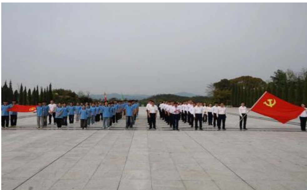
图 2：兴国中专开展清明祭扫活动