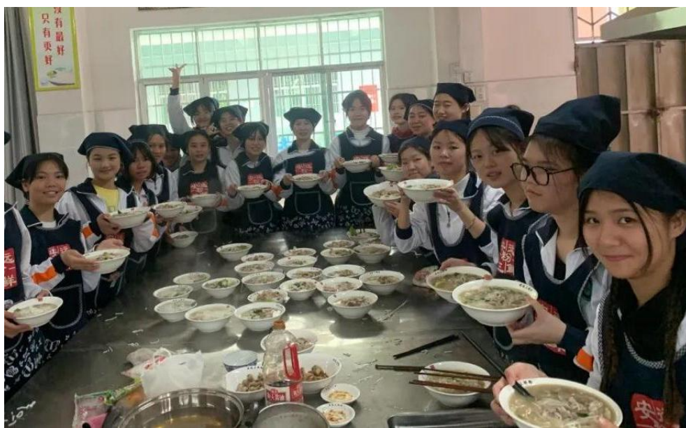
图 12：安远中专毕业生参加三鲜粉制作生活技能培训

安远中等专业学校以职业教育资源为平台培养当地特色劳动力，开展“安远三鲜粉名小吃”就业技能培训，助力脱贫解困和乡村振兴。安远县委、县政府投入资金30多万元，在安远中等专业学校创建集安远名小吃培训、创业指导、品牌推广于一体的“安远三鲜粉师傅”劳务品牌项目运营中心。项目运营中心将达到完成安远名小吃培训500名以上，参训人员结业后就业率达90%，其中从事餐饮服务行业创业人员不少于20%，培训补贴落实率达100%，带动就业12000人以上，安远名小吃劳务人员满意度达95%以上的培训规模。