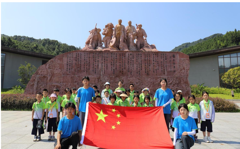
图 9：江西信丰星泓职业学校学生带团走进信丰县油山镇

江西信丰星泓职业学校紧密贴合本地文旅资源，依托研学基地积极开展研学旅行课程，以实际行动为地方旅游产业发展贡献力量。国庆期间，27 名旅游专业学生参与信丰油山义务讲解活动，为游客提供专业、生动的讲解服务，接待游客 241 人次。同时，学校勇担责任，连续三年承办研学旅行省、市赛，成功吸引 50 余所学校、800 余名师生汇聚信丰，极大地提升了信丰文旅的曝光度与影响力。