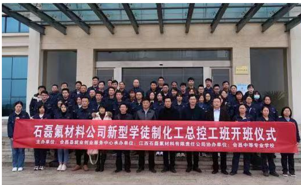
图 10: 会昌中专与石磊氟材料公司开展新型学徒制培训

会昌中等专业学校充分发挥学校专业优势, 全力配合县域经济发展。为更好服务会昌县氟盐新材料首位产业, 学校建立化工安全技能实训基地, 开设氟盐化工订单班, 采取校企联合培养模式, 为江西会昌工业园区管委会提供人才支撑。管委会每年安排园区内企业技术人员定期到学校授课, 进行实训指导; 学校教师、学生也定期到工业园区内的企业学习、实习, 相互交流, 共同为企业培养高技能岗位人才。