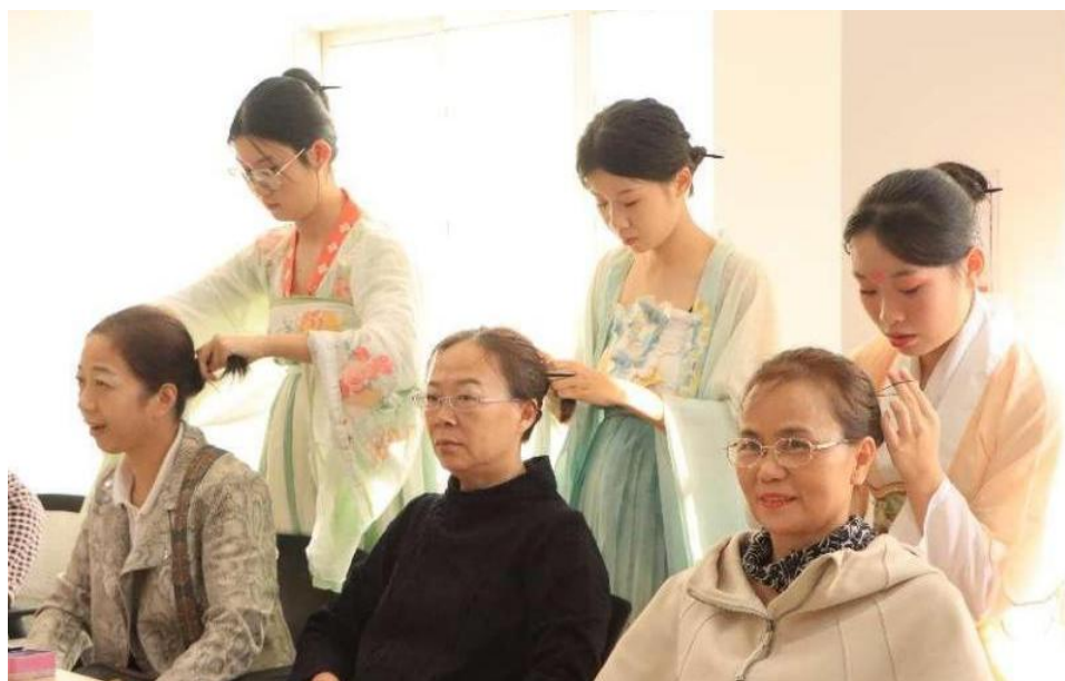
图 13：崇义中专学生为社区居民盘发

崇义中等专业学校师生代表赴阳岭社区开展了主题为“巧手制发簪，古韵共传承”的中华优秀传统文化进社区、工匠文化进社区特色教育教学系列活动，为居民们讲解了传统礼仪知识，解读了现代发簪制作的技巧及使用的方法，并指导居民制作发簪、盘发和妆扮，进一步丰富社区群众的业余生活，提升群众的精神价值需求。