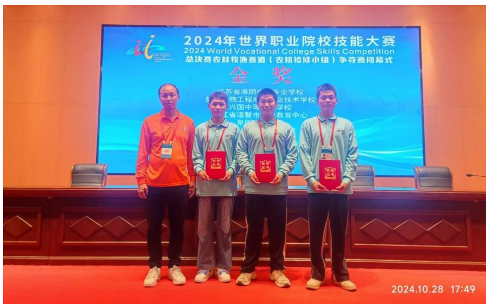
图 6: 兴国中专获世界职业院校技能大赛农机检修组赛项金奖

兴国中等专业学校作为全省唯一中职学校承办2024年世界职业院校技能大赛农机检修组赛项，并获得金奖，实现赣州市世界职业院校技能大赛（中职组）金奖“零突破”。学校以高标准、高质量、高要求、高水平的“四高”标准，确保赛事组织严谨有序、服务保障细致高效，获得了参赛团队和大赛组委会的高度评价。