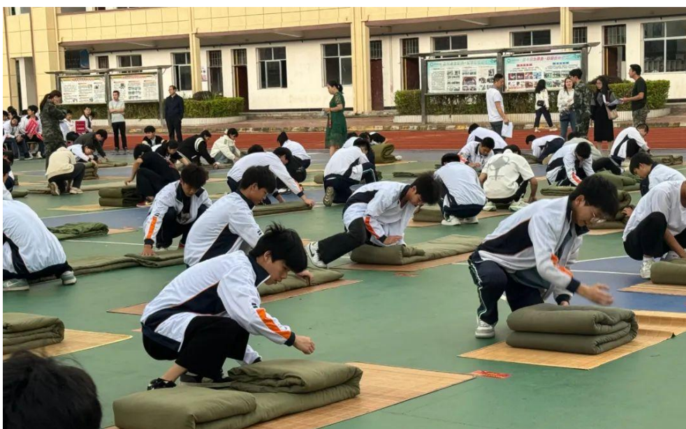
图 4：安远中专开展“三树三养”主题教育——叠军用被比赛

信、树立榜样，养成好习惯、养成好品格、养成好本领”，努力提升综合素养。以主题班会、专题报告、演讲比赛、励志电影、社团活动、文明创建、志愿服务等活动为抓手，从学生日常生活、技能学习、品格塑造、理想信念等方面入手，多形式、多层次地开展各类活动，不断丰富学生的课余生活，营造浓厚的“人人争先、个个出彩”校园文化氛围，着力培养学生良好的生活习惯、优秀的思想品德和浓厚的家国情怀。