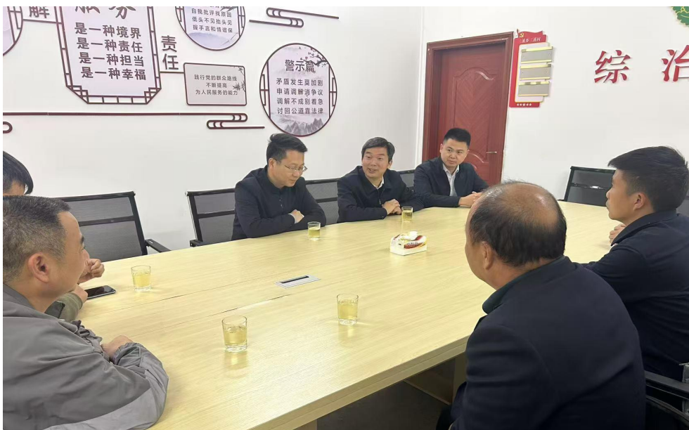
图 11：赣州农业学校开展驻村帮扶工作

赣州农业学校全面贯彻落实乡村振兴工作部署，定点帮扶信丰县大塘埠镇万星村，压实驻村工作队责任，做好产业、就业、教育帮扶，通过定期跟踪走访村民、村小组、脱贫户、三类对象等，解决村民迫切需求，规划长期经济发展项目，巩固拓展脱贫攻坚成果。2024 年，学校派遣并调整驻村干部 3 人，结对帮扶万星村 18 户 57 人。