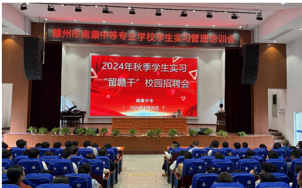
图 7：南康中专邀请本地优质企业入校开展校园招聘会

南康中等专业学校邀请本地优质企业入校开展校园招聘会，如格力电器（赣州）有限公司、美克数创（赣州）智造有限公司等企业，提供近千个岗位需求，搭建企业与毕业生的供需平台，为学生实习就业提供了多样化的选择，也助力为本地输送更多优秀技能技术人才。