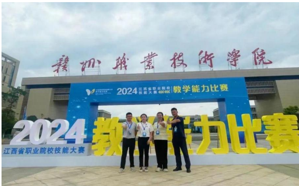
图 3: 于都中专党员教师在省教学能力比赛斩获一等奖